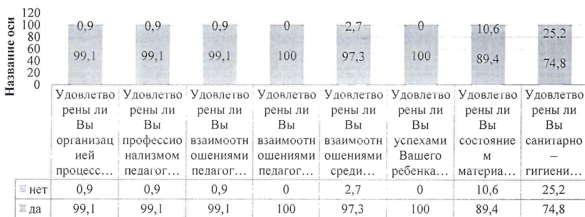
Удовлетворенность организацией дополнительного образования в МБОУ "СОШ №3"

Вместе с тем, родители отметили, что посещение объединений дополнительного образования способствует развитию интересов, способностей ребенка, подготовке к получению профессии, самопознанию и самосовершенствованию ребенка, возможности стать успешным человеком в будущем, познанию и пониманию окружающей жизни.